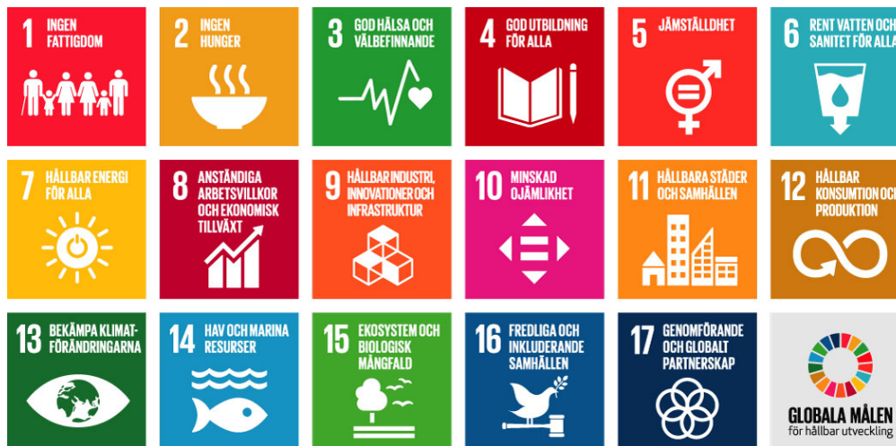
Bild: De globala målen AGENDA 2030.

Genom att utgå från AGENDA 2030 och hållbarhetsmålen för våra mål och insatsområden säkras vi att projekt och verksamhet bidrar till en hållbar omställning och värnar kommande generationer.